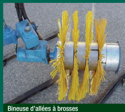
Bineuse d'allées à brosses

Généralement constitués avec des éléments de type patte d'oie, certains prototypes à brosses, sont également étudiés.