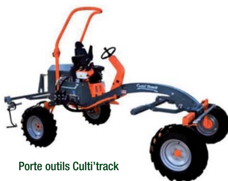
Porte outils Culti'track