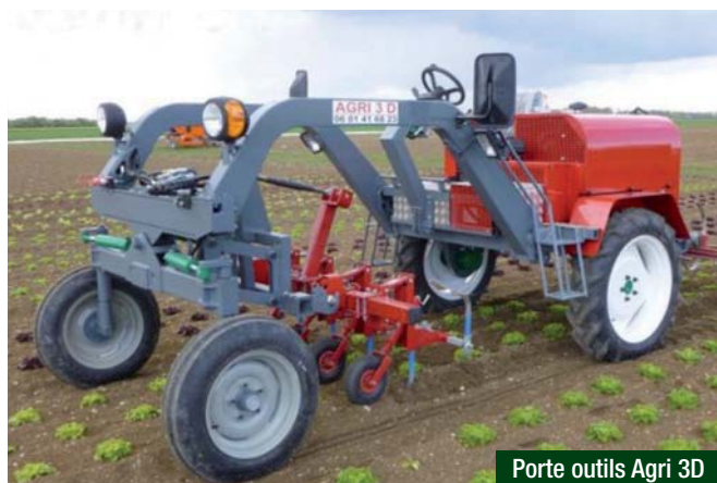
Porte outils Agri 3D

De nombreux outils et adaptations d'outils existants ont également été diffusés, adaptés et conçus par l'Atelier Paysan.