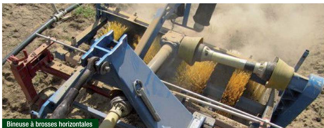
Bineuse à brosses horizontales