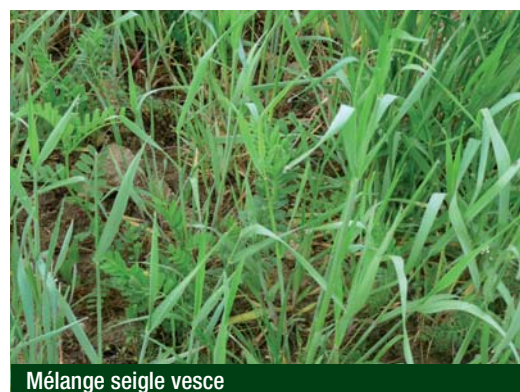
Mélange seigle vesce

La maîtrise de l'engrais vert passe par une bonne qualité d'implantation qui fournira une couverture rapide du sol. Un désherbage mécanique (herse étrille) peut être envisagé dans le cas d'un engrais vert mono-espèce.