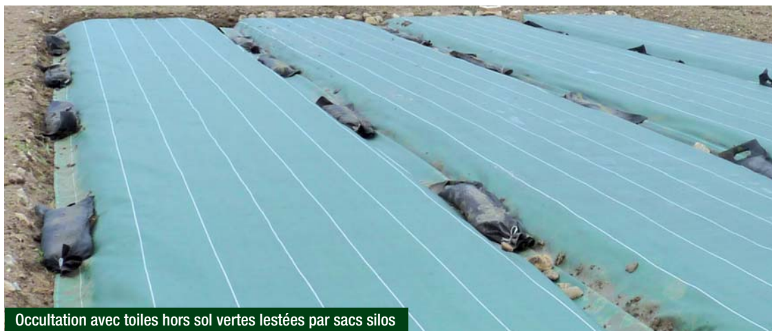
Occultation avec toiles hors sol vertes lestées par sacs silos

Les graines d'adventices placées en conditions humides et sous l'influence du rayonnement solaire (augmentation de la température) lèvent puis périssent en l'absence de lumière. La durée de couverture est variable selon la saison, les conditions climatiques et le type de sol, 4 à 8 semaines en général (plus si couverture hivernale).