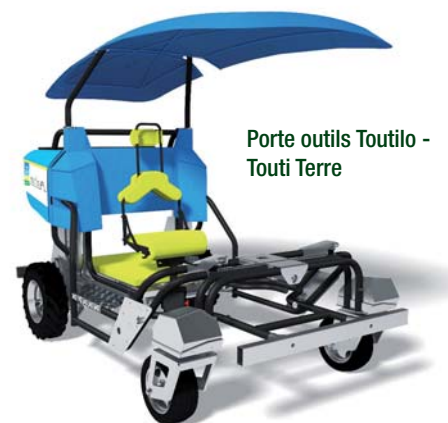
Porte outils Touti - Touti Terre