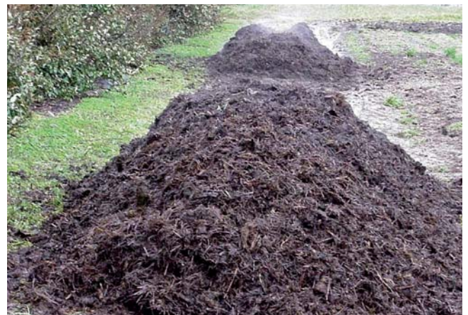
Andain de compost après retournement