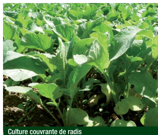
Culture couvrante de radis

Il en va de même de la pratique de cultures dérobées « étouffantes », comme certains engrais verts, et de cultures nettoyantes (plantes sarclées, plantes buttées).