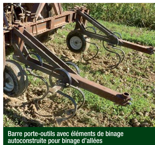
Barre porte-outils avec éléments de binage autoconstruite pour binage d'allées