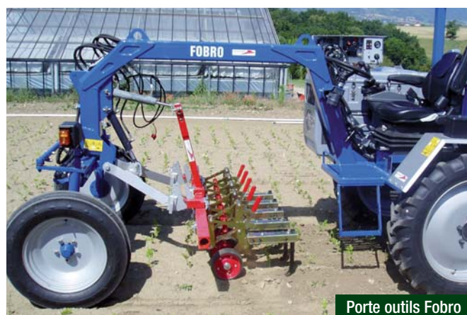
Porte outils Fobro

Quelques constructeurs et distributeurs (liste non exhaustive) :