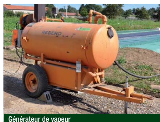
Générateur de vapeur