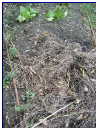
Tiges de haricots séchées

Il faut toujours veiller à ce que le sol puisse respirer . On évitera donc les paillis trop denses ou trop épais