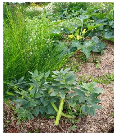
Photo de gauche, Mai 2012 : autour des buttes couvertes, les plantes spontanées s'installent.