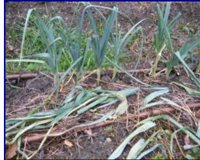
Fanes de poireaux

Sans oublier qu'à chaque fois que vous cueillez un légume (un poireau, des radis), vous pouvez au même moment enlever les parties abîmées (les pointes vertes du poireau, les fanes des radis) et les remettre sur le sol.