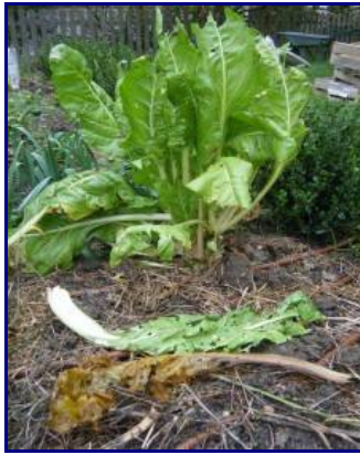
Feuilles de poirée en cours de décomposition

En fait, c'est très simple : composter en surface, c'est déposer des déchets végétaux directement sur le sol de son potager.