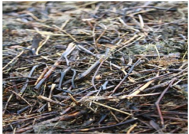
Butte recouverte d'un mix de pelouse, feuille et petites tailles de haies.