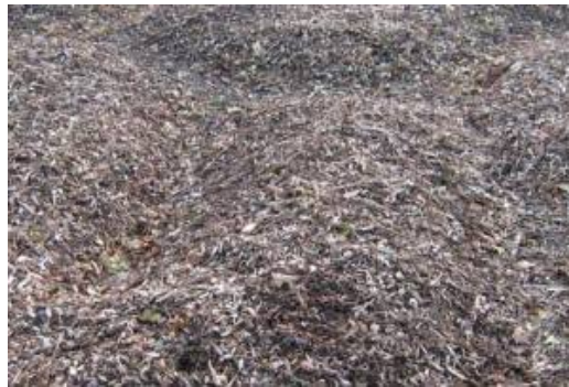
Bois Raméal Fragmenté (BRF)

Bien qu'inexpérimenté en la matière (je vais faire mon premier essai cette année), j'ai choisi de vous parler ici de BRF. Cette technique innovante d'enrichissement du sol (mais pas seulement comme nous allons le voir plus loin) a, j'en suis persuadé, un bel d'avenir devant elle.