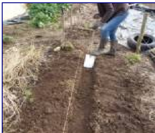
Je creuse l'allée et je mets la terre sur les buttes.