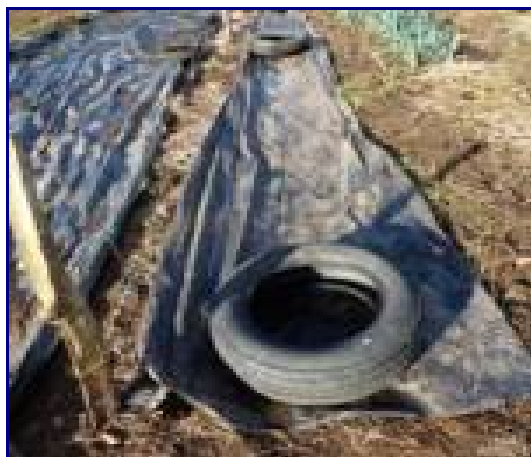
Préparation du sol