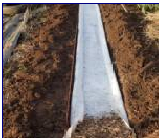
Je pose le géotextile