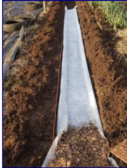
Création d'une allée de 50 cm de large entre les buttes

Je creuse des allées de 50 centimètres de largeur. Mes buttes font, elles, environ 1,20 mètre de large. Je creuse, grosso modo, sur la profondeur de la bonne terre (environ 20 centimètres). J'étale cette bonne terre sur les buttes qui de ce simple fait deviennent déjà plus riches !