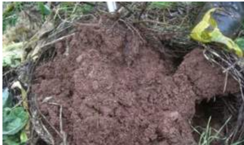
Structure au mois de décembre après 14 mois sans travail du sol