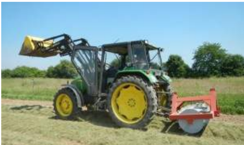
Roulage du transfert-mulch