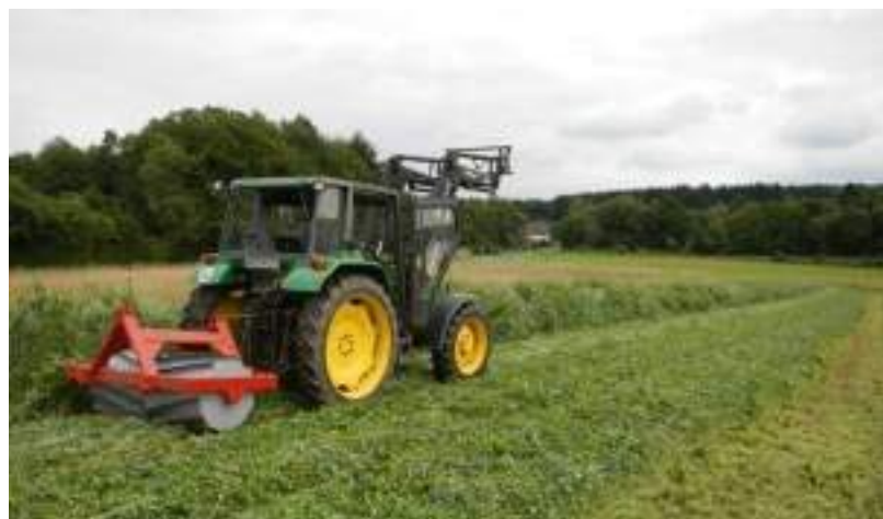
Destruction de l'engrais vert vers la fin de la floraison