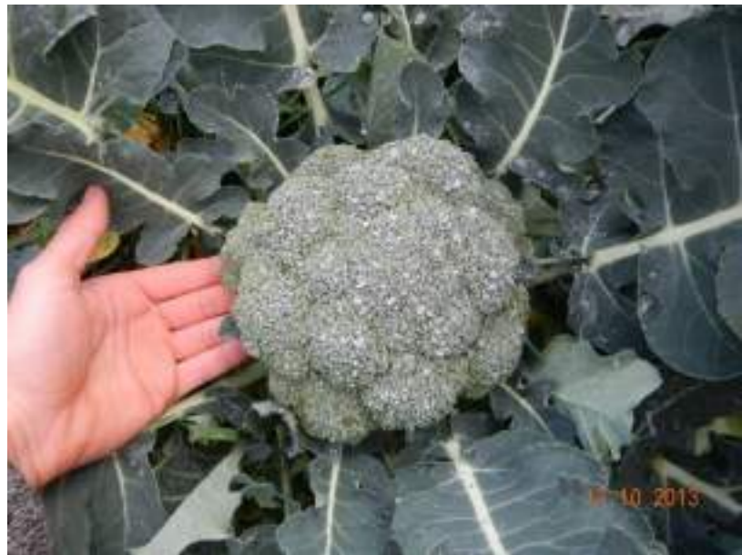
Brocoli en plantation directe