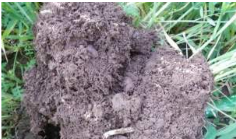
Structure au mois de mai après 8 mois sans travail du sol