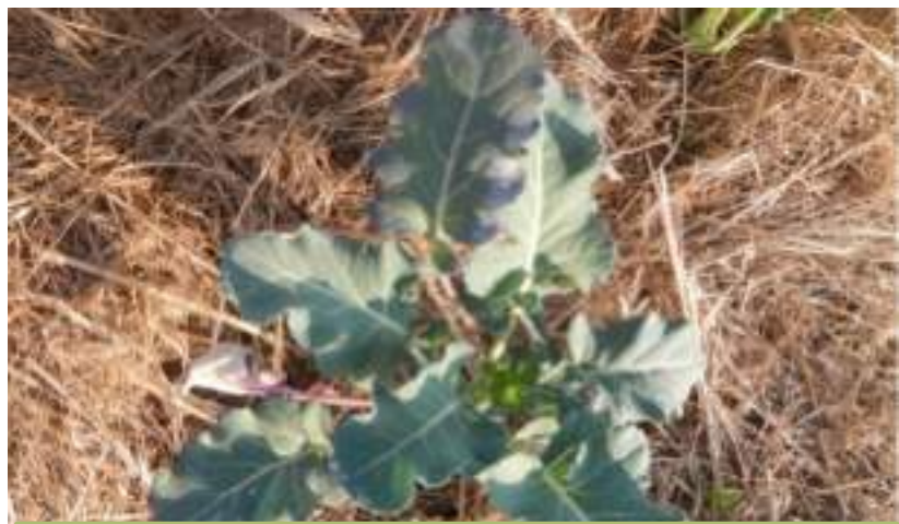
Bonne récupération après 16 jours