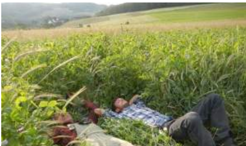
Economie de temps !!!