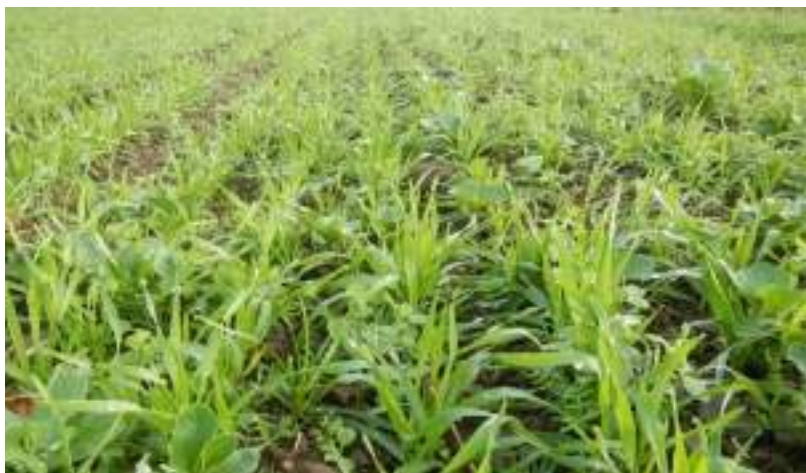
Semis optimal et tôt de l'engrais vert