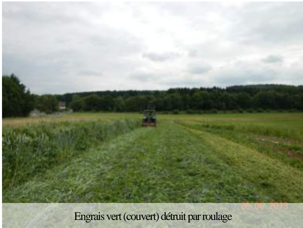
Engrais vert (couvert) détruit par roulage

Le roulage aère moins le mulch, ce qui est préférable, et est plus économe en énergie.