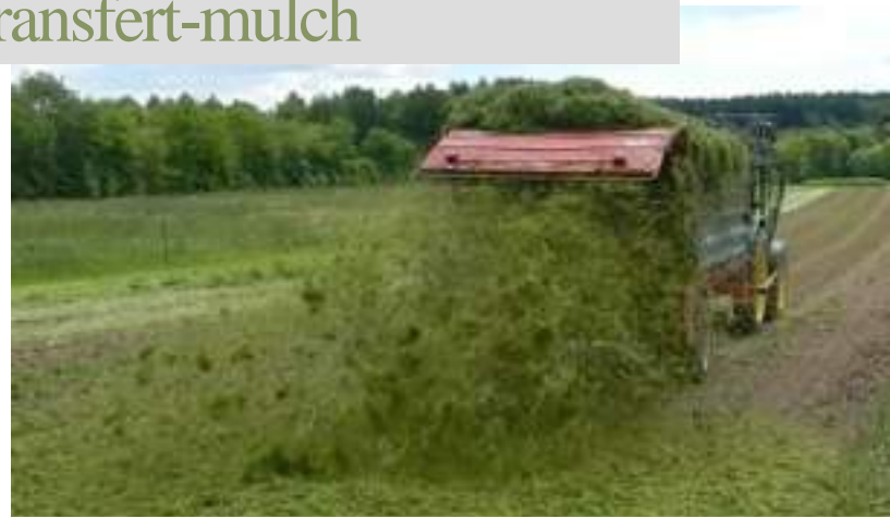
Apport de transfert-mulch