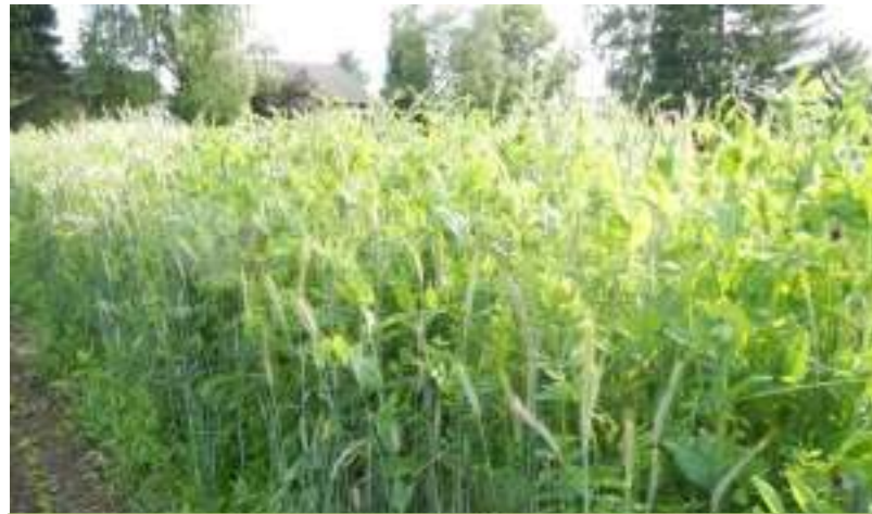
Biomasse élevée, min. 10 t MS/ha et bonne structure du sol