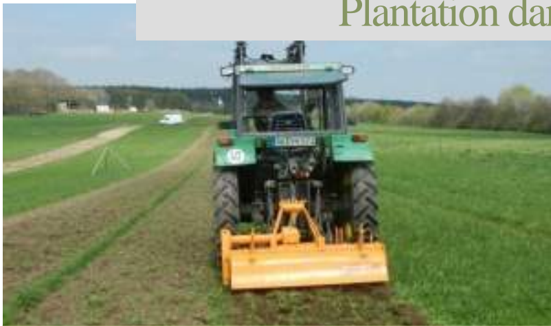
Travail du sol habituel avec fertilisation