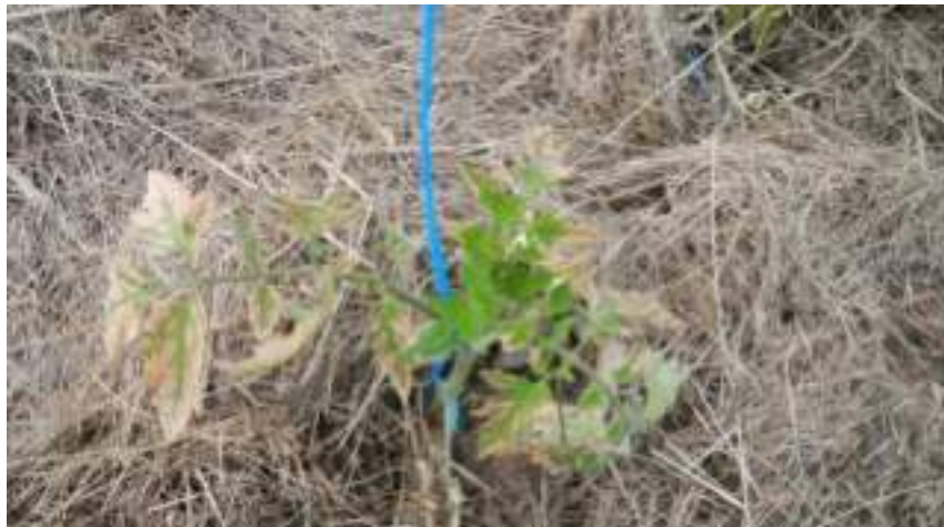
Tomates sous serre dans mulch à base d'ensilage