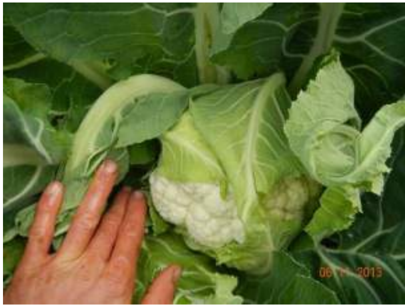
Choux fleur en plantation directe