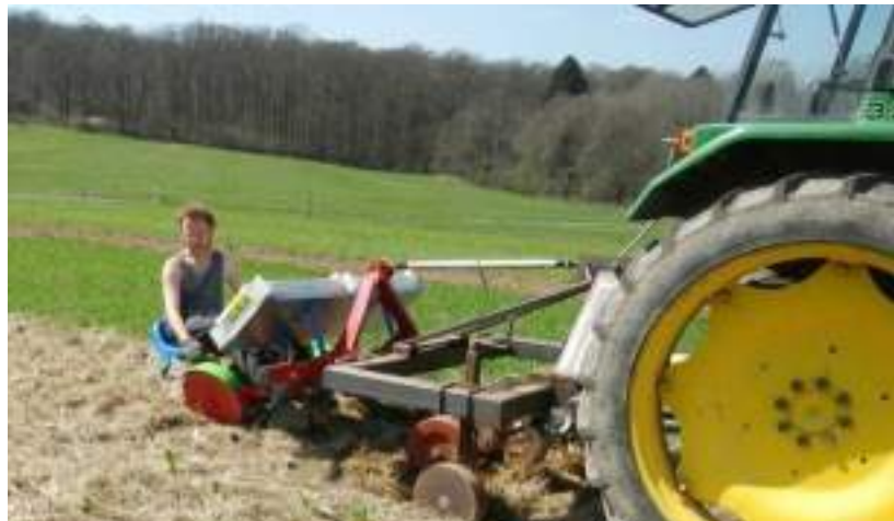
Plantation avec le système de plantation RMS