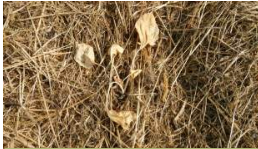
Choux de Bruxelles dans mulch vert et couvert de P17