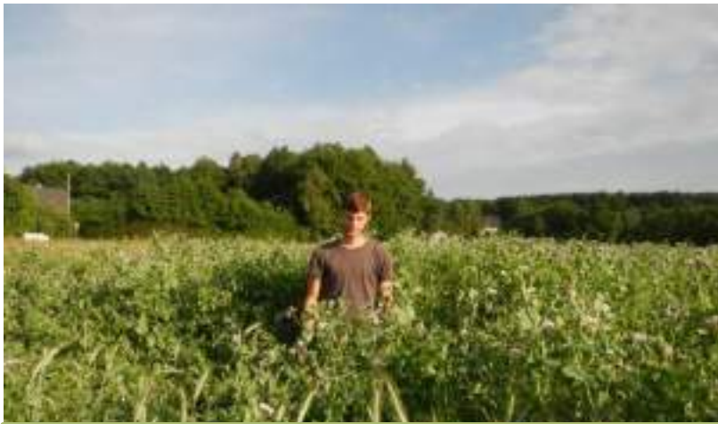
Triticale-Vesce-Pois-féveroles 9t MS/ha