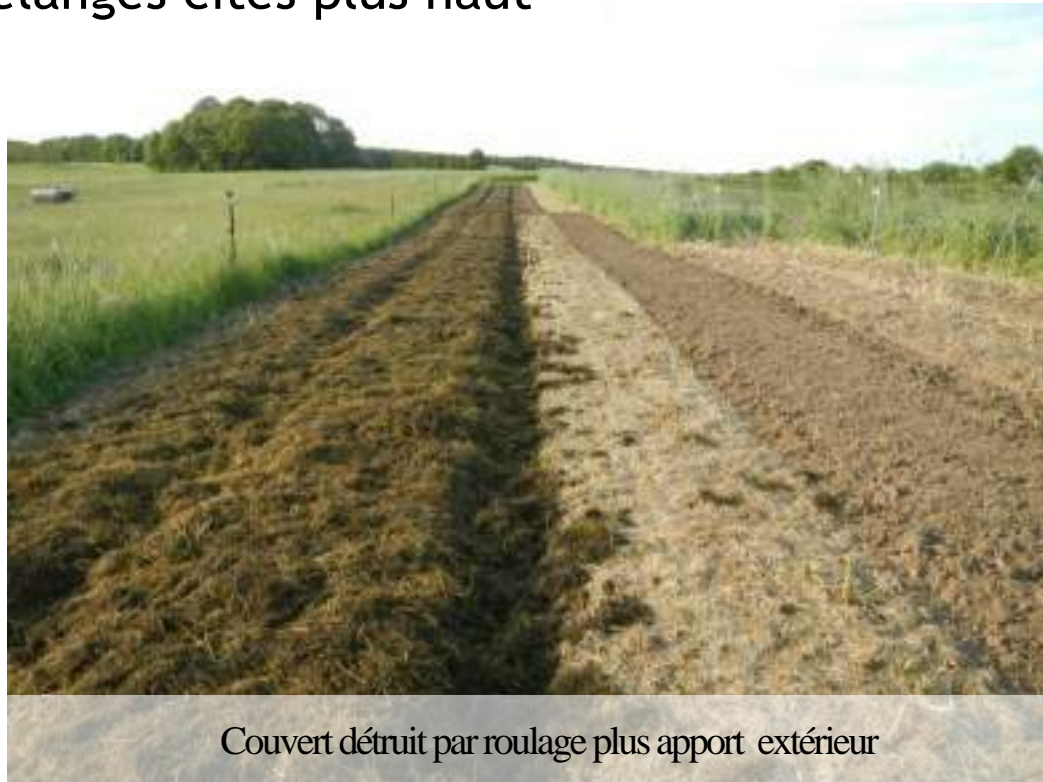
Couvert détruit par roulage plus apport extérieur