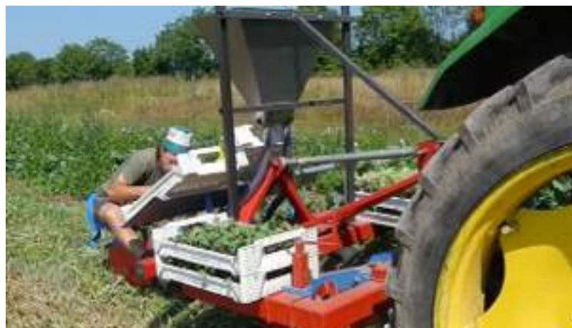
Repiquage avec la planteuse RMS et fertilisation localisée sous la racine (Unterfußdüngung)