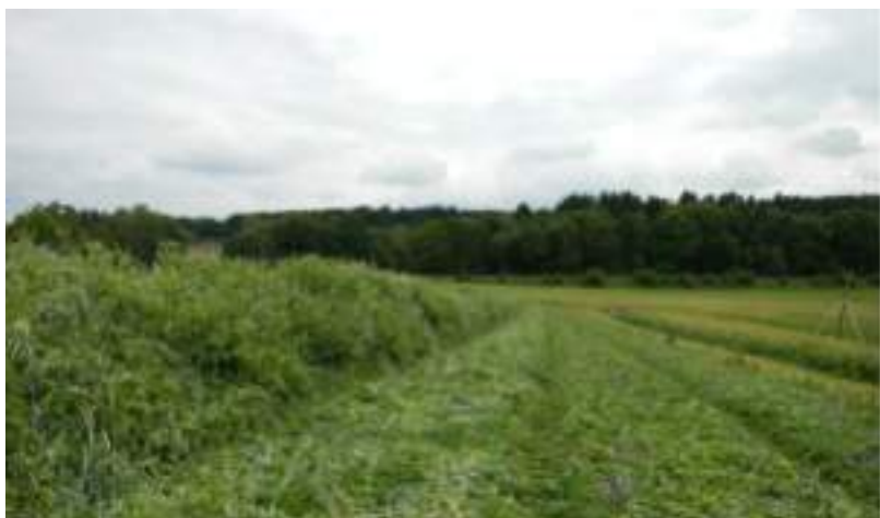
Production de la biomasse sur place