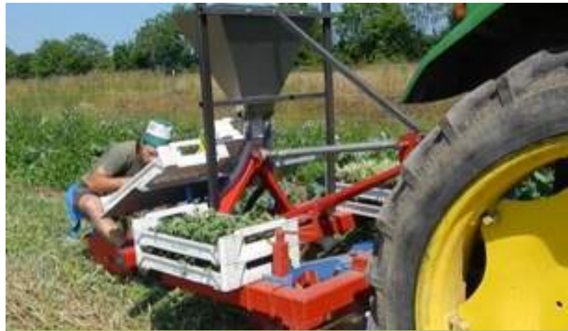
Plantation + 100 kg N et 40 kg S/ha