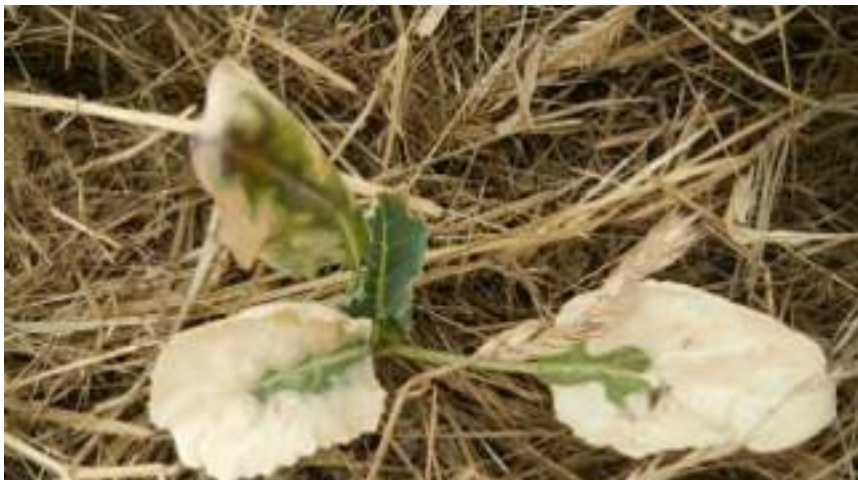
Brocoli dans mulch à base d'ensilage