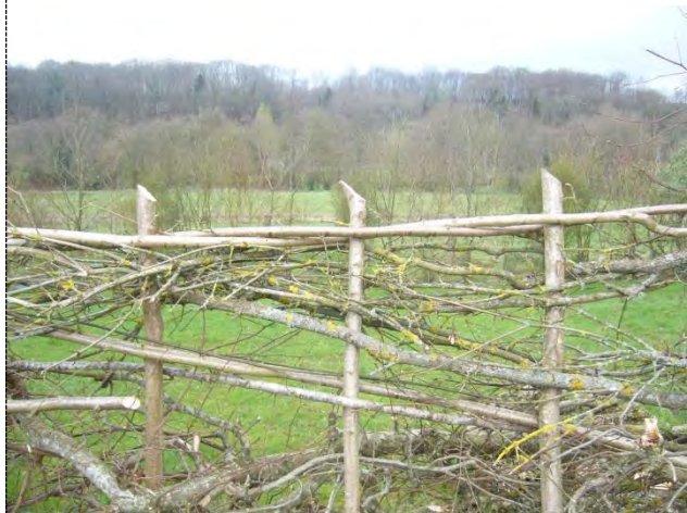
Parure simple en noisetier