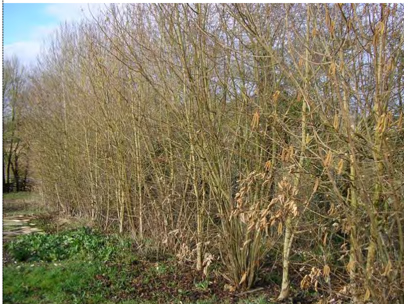
Haie de noisetier avant plessage

Une jeune haie, une haie recépée, une haie vieillissante