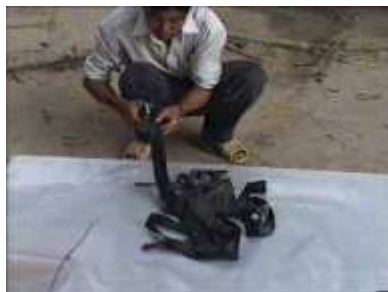
Photo 22. On découpe une bande de caoutchouc