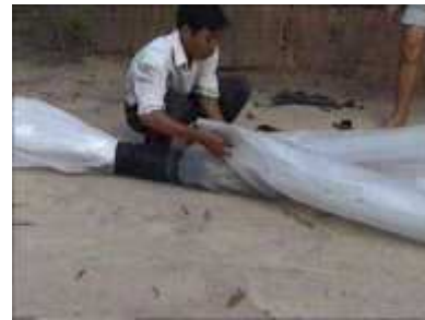
Photo 32. On place un tube de plastique supplémentaire d'une longueur de 3m