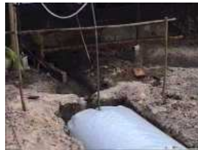
Photo 65. Le conduit est relié au digesteur