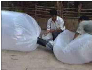
Photo 37. On complète jusqu'à ce que le tube principal soit rempli d'air