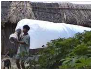
Photo 39. Transport du digesteur

L'air est maintenant piégé à l'intérieur du digesteur et l'on peut retirer les films de plastique à l'entrée et à la sortie du digesteur.