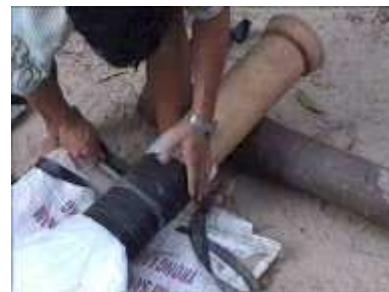
Photo 23. On enroule le caoutchouc autour du plastique pour le fixer au tube