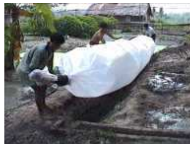
Photo 40. On place le digesteur dans la tranchée