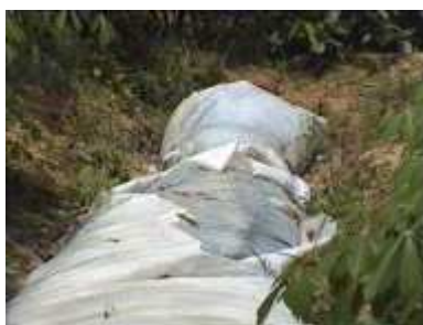
Photo 79. La couche supérieure de plastique est déchirée (au bout de 3 ans)