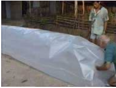
Photo 29. Le digesteur est rempli d'air