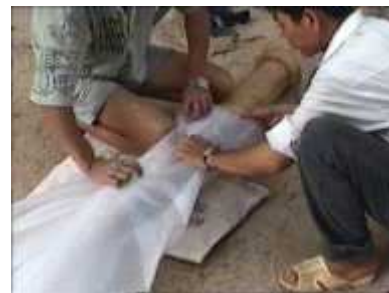
Photo 21. Nous sommes prêt à fixer les éléments ensemble