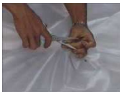
Photo 15. Découper le plastique