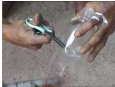
Photo 46. On fait un trou pour ajouter de l'eau