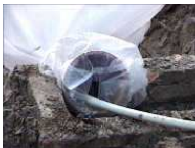
Photo 44. On peut brancher un tuyau d'arrivée d'eau si une pompe est disponible