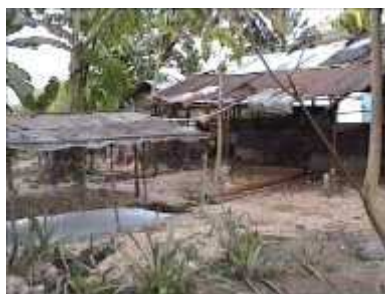
Photo 74. Le système complet : un toit peut protéger le biodigester des rayons UV.