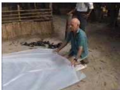
Photo 27. Tenir le plastique