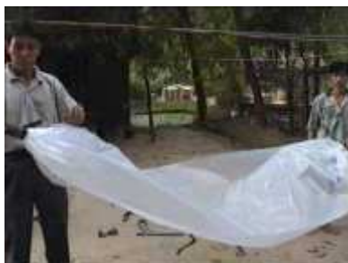
Photo 56. On assure une bonne connexion entre les deux éléments