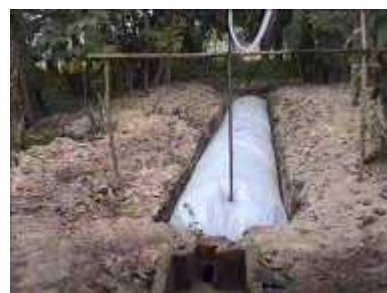
Photo 67. L'installation est terminée