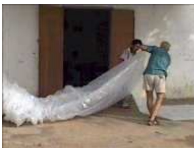
Photo 11. On place les deux pièces de plastique l'une dans l'autre