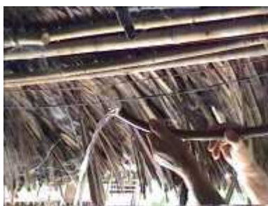
Photo 76. Accumulation d'eau (pb 6-1) : ouvrir le joint pour évacuer l'eau