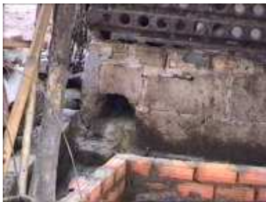
Photo 64. Un conduit est réalisé à l'aide de briques pour diriger les déchets liquides vers l'entrée du digesteur

On peut réaliser un conduit à l'aide de briques et de ciment pour relier l'évacuation des déchets et le tube d'entrée du digesteur.