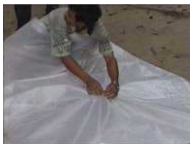
Photo 14. Maintenir le plastique