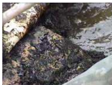
Photo 81. Couche dure de fumier du à l'accumulation de terre et au temps (3 années)