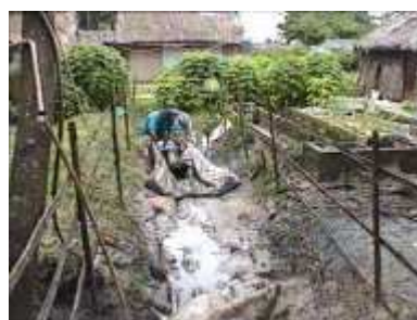
Photo 83. Tirer le plastique hors de la tranchée