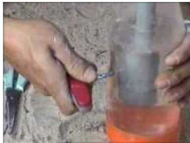
Photo 47. On insère le tube en PVC dans la bouteille, on remplit d'eau et on fait un petit trou pour fixer le niveau d'eau