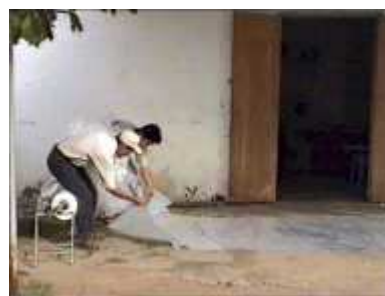
Photo 10. Début de la phase d'enfilement des deux pièces de plastique qui augmentera la résistance du digesteur