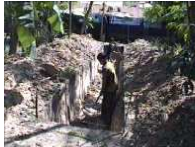
Photo 5. Réalisation d'une tranchée dans le sol

Afin de faciliter l'écoulement du lisier, il est préférable que celui-ci coule par gravité directement de la source vers l'entrée du digesteur.