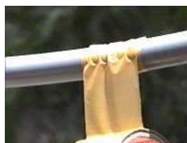
Photo 77. Faire un trou dans le conduit en PVC, laisser couler l'eau, reboucher avec une bande de scotch (pb 6-2)