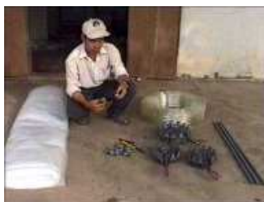
Photo 6. Matériaux nécessaires à la mise en place d'un digesteur en plastique