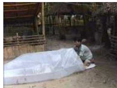
Photo 34. On pompe à nouveau l'air à l'intérieur du tube en plastique