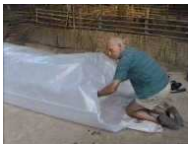
Photo 28. On pompe l'air pour remplir le digesteur