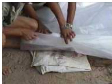
Photo 20. On recouvre de chaque côté