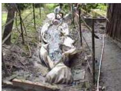
Photo 82. Après avoir retiré toute la matière