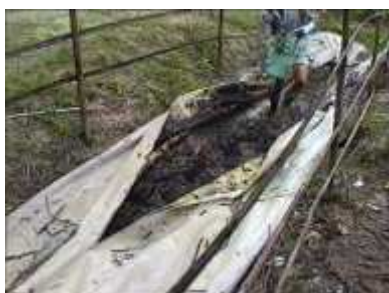
Photo 80. On découpe le plastique pour retirer la matière