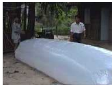
Photo 38. Le digesteur est maintenant rempli d'air