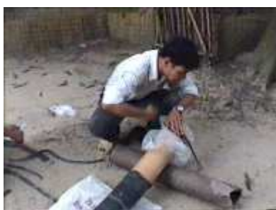
Photo 25. On ferme l'ouverture du tube d'entrée avec un sac plastique

Ensuite, il faut remplir le tube plastique d'air avant de le placer dans la tranchée.