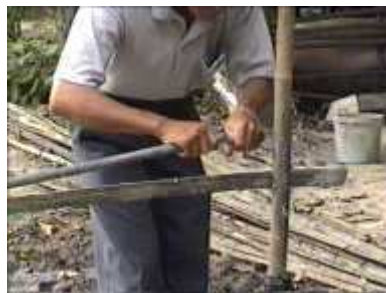
Photo 43. Connexion du tuyau de distribution du gaz au support