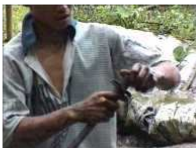
Photo 84. Récupérer le système de captage du gaz