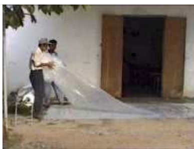
Photo 9. On met en boule une des deux pièces de plastique afin de la mettre à l'intérieur de l'autre