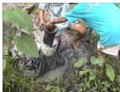
Photo 85. Récupérer les bandes de caoutchouc et les tubes d'entrée et de sortie du fumier