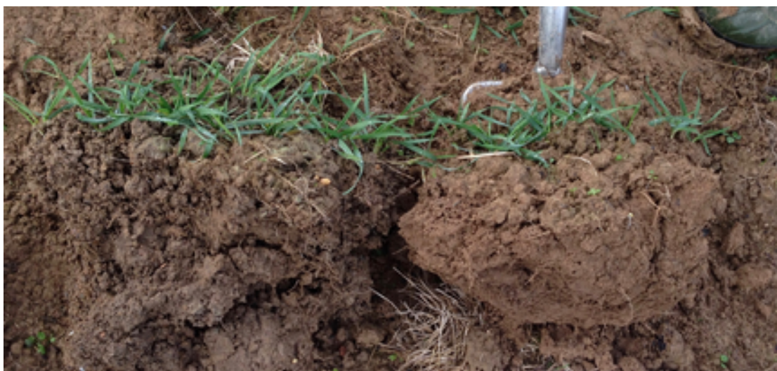
Évolution de sol sur céréales 2 mois après le premier passage de 500P, biodynamie à gauche, témoin bio à droite.

Ceci ne nous renseigne pas sur la durabilité et sur le potentiel de mobilisation des éléments minéraux dans le sol pour les mettre à la disposition des plantes, ni sur les possibilités de libération d'éléments à partir de la roche mère.