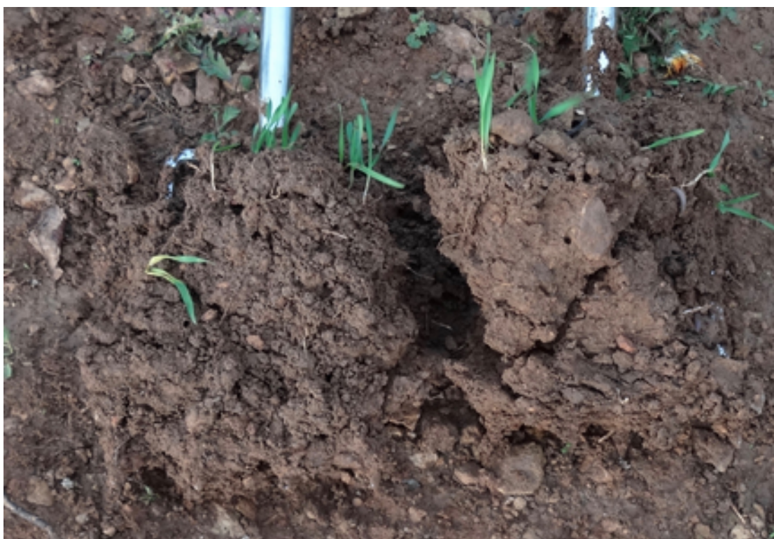
Évolution de sol en 8 mois de biodynamie en vigne à gauche, témoin bio à droite.