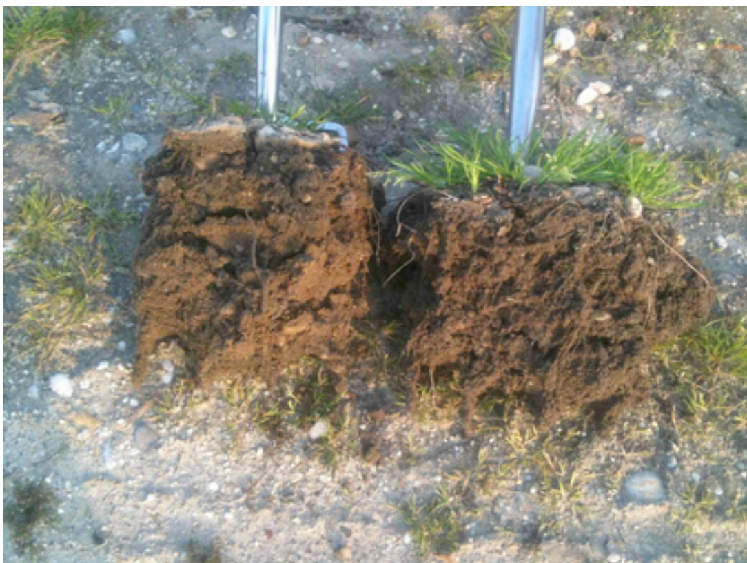
Évolution de sol en une année avec l'emploi de la 500P sur sol de vigne à droite, témoin bio à gauche.