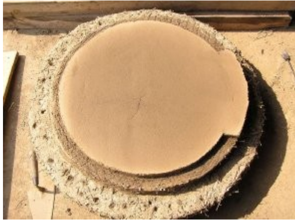
Une fissure lors du séchage