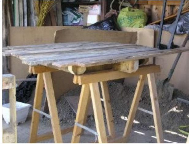
Plateau en lames de palette