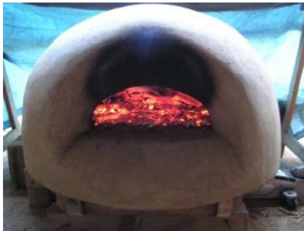
Premier gros feu après un long séchage et petits feux préliminaires