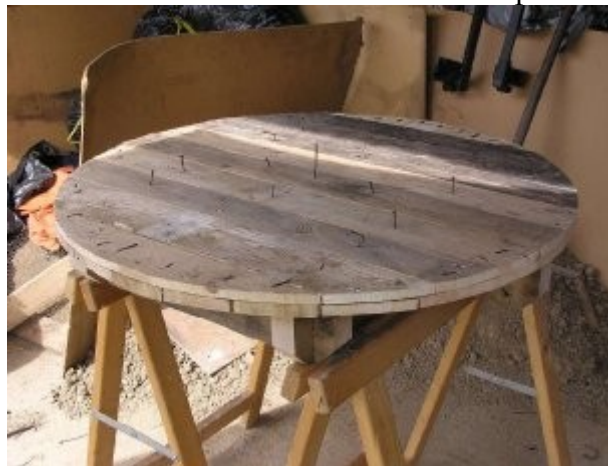
Quelques clous pour l'accroche de la couche paille-terre