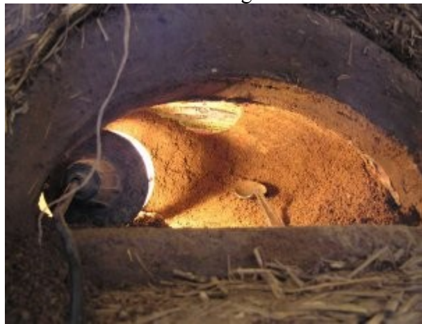
Evacuation du dôme de sable