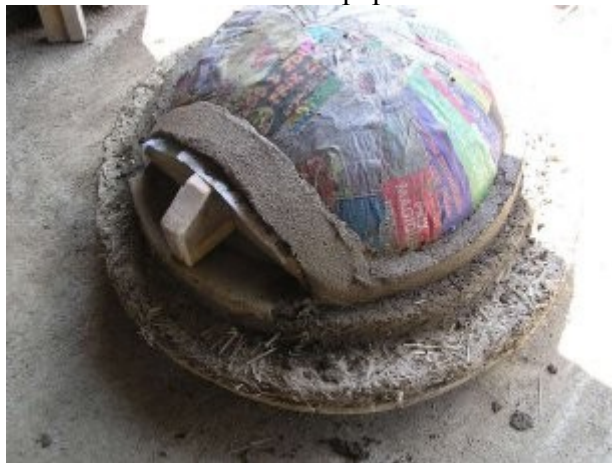
Début de la couche terre-sable