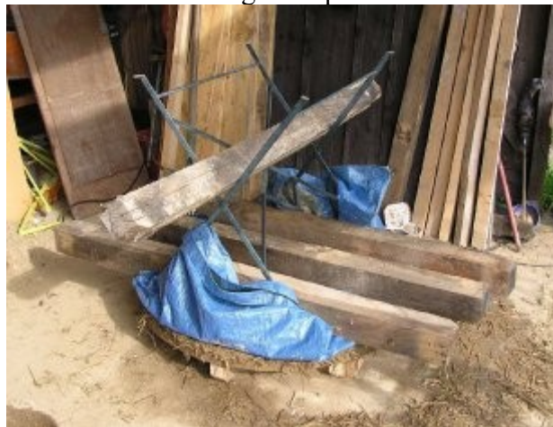
Tassage à la table de jardin !