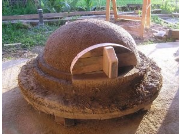
Dôme de sable et porte