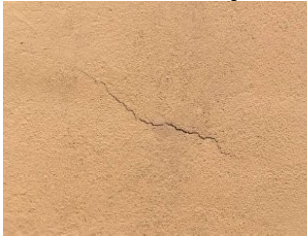
La fissure en gros plan