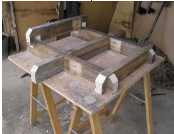
Assemblage structure à mi-bois