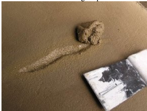
Rebouchage de la fissure