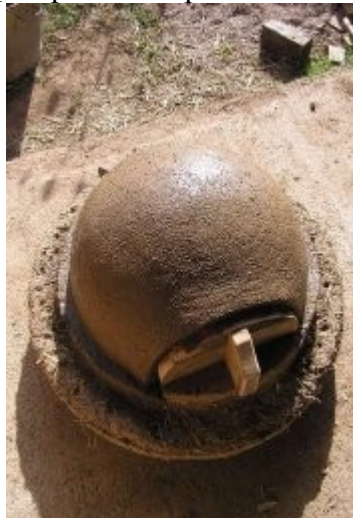
Barbotine juste avant la couche terre-paille