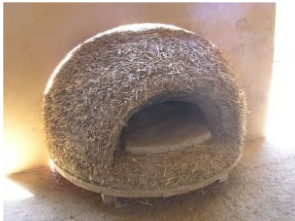
Coupe de la couche paille-terre et contrôle de la forme