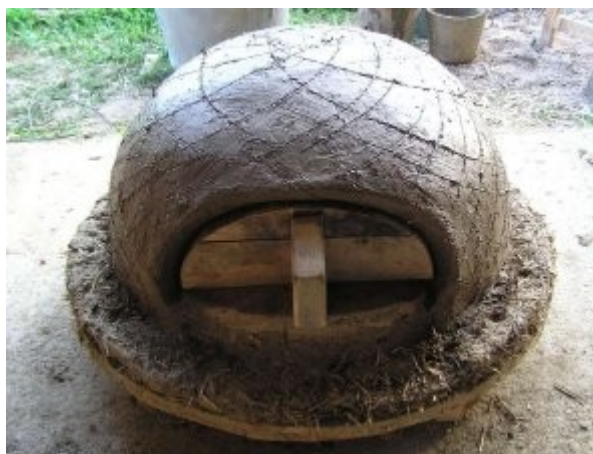
Quelques stries pour l'accroche