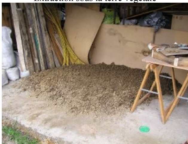
Argile avant tamisage