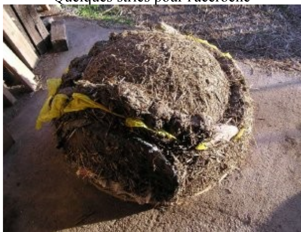
Coffrage devant la porte et début de la couche paille-terre