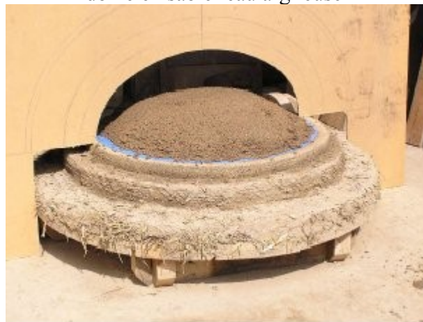
Utilisation du gabarit