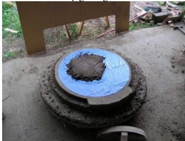
Sur le plastique, je commence le dôme en sable+eau argileuse