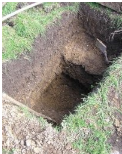
Extraction sous la terre végétale