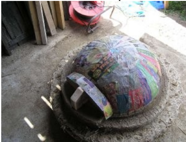
Couche de papier