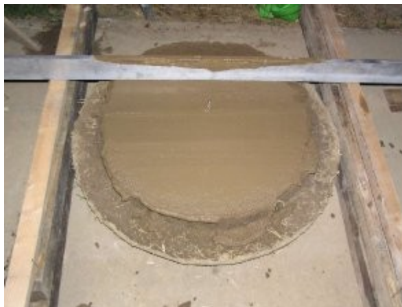
Barbotine et mise à niveau