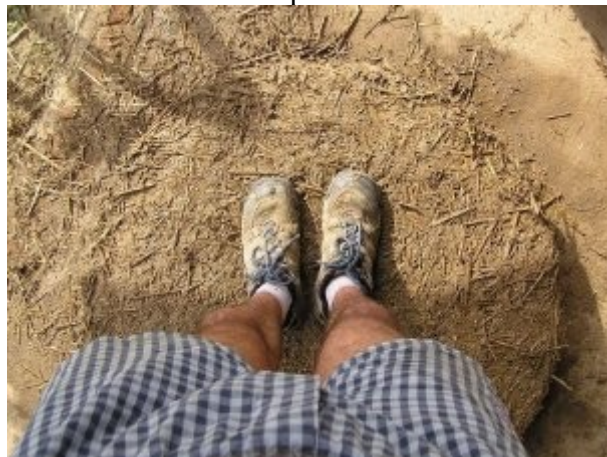
Tassage aux pieds