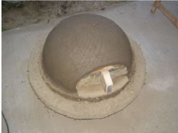
Quelques stries pour l'accroche