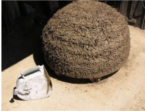
Passage de la tyrolienne avant l'enduit final