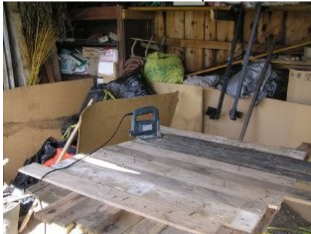
Couche de lames croisées et découpe