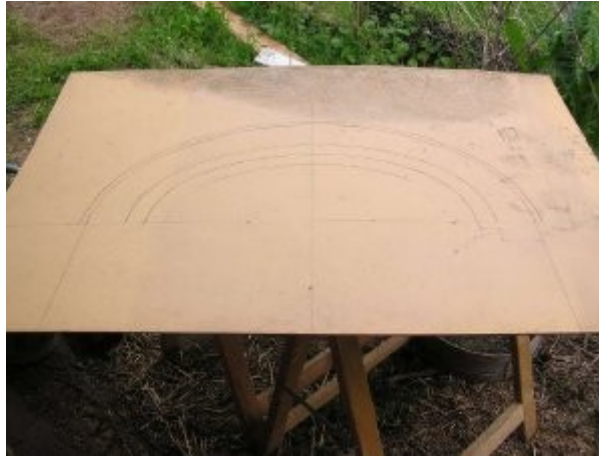
Traçage du gabarit