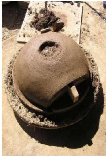
Tasser et lisser fortement à la truelle