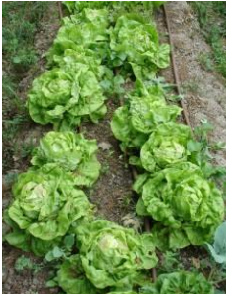
Laitues d'hiver pommées en avril

Tout d'abord, il faut savoir que la salade est une plante qui préfère des températures d'une certaine fraîcheur pour pousser, comme c'est le cas en automne et surtout au printemps. Par contre en été et en hiver, il faudra jouer sur des variétés adaptées pour obtenir de bons résultats.