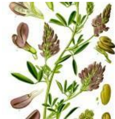
Illustration de la luzerne.

Dans un potager bio, il est important de pailler, je ne vais pas rappeler ici les raisons. Pour pailler les cultures du potager de nombreux matériaux peuvent être prélevés dans un jardin, par exemple si vous avez une zone plus naturelle vous pouvez couper des herbes au printemps et utiliser ce matériau une fois qu'il est sec.