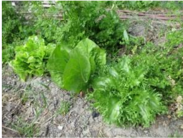
Des chicorées plantées en automne

A partir du 15 août (et même avant dans les régions aux étés frais) et jusqu'à fin septembre, c'est la bonne période pour semer de la mâche et des salades de la famille des chicorées. Elles ont des feuilles plus coriaces que les laitues, ce qui va leur permettre de bien résister aux gelées de l'hiver. Souvent très colorées avec des marbrures rouges et vertes ou des feuilles rouges aux nervures blanches, elles sont très décoratives dans les assiettes.