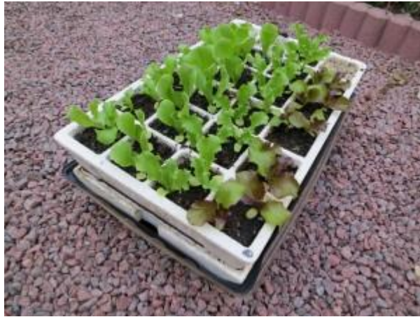
Semis en barquette auto-irrigante

En avril, on peut commencer à semer des laitues qui seront récoltées en juin/juillet. Il existe une multitude de variétés, mes préférées sont deux variétés anciennes faciles à réussir : la 'Reine de Mai' et en batavia la 'Rouge Grenobloise'.